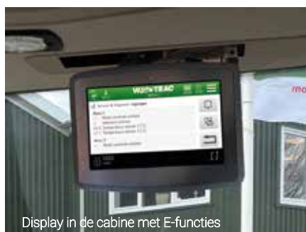
Display in de cabine met E-functies

Kijk voor meer details op www.hue-trac.nl